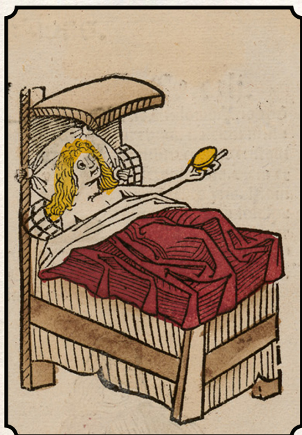
Lyst, Most Unnatural