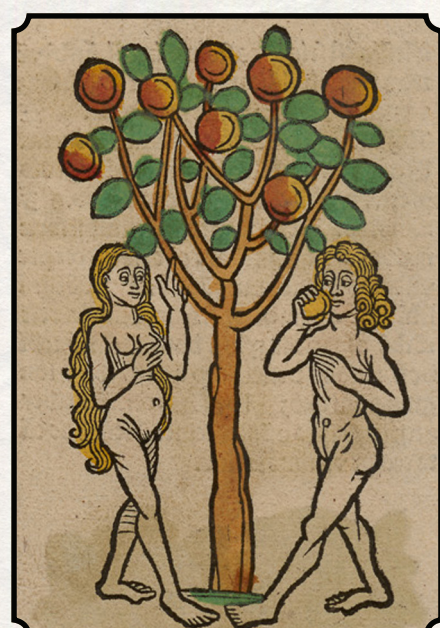
Ægte Kærlighed, Star-Crossed