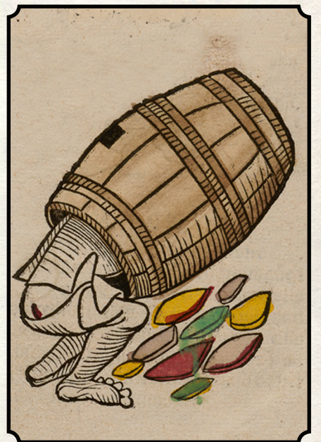
Clown, a Fool