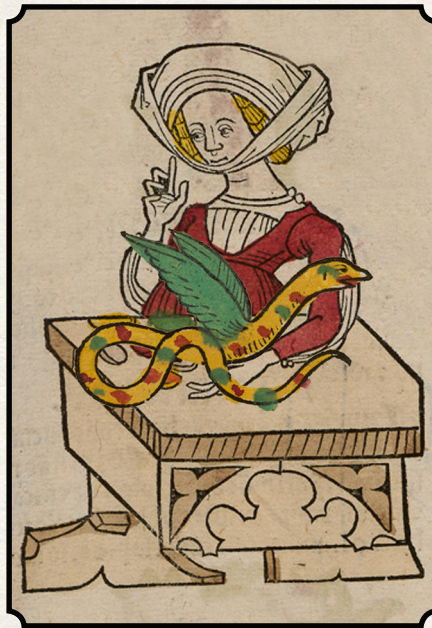
Pernelle, the Lusty Queen