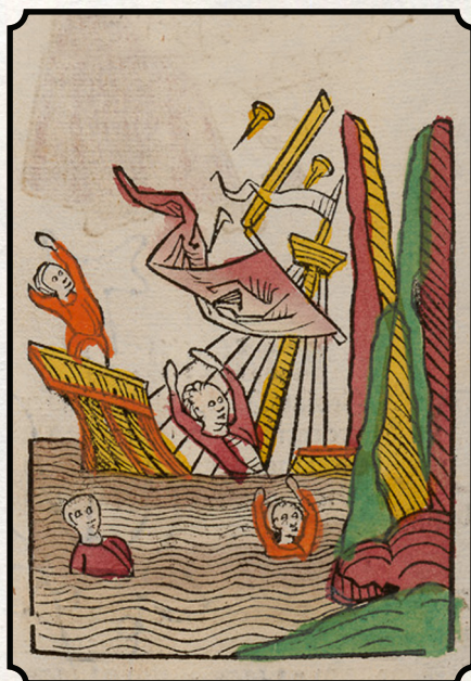
Katastrofe, Upon the Seas