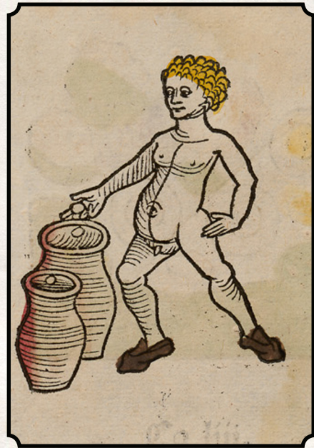
Glæde, Capers & Poesy