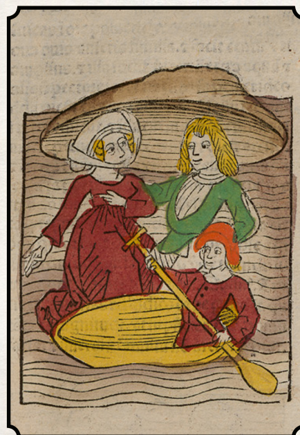
Forvisning, Hasty & Cruel