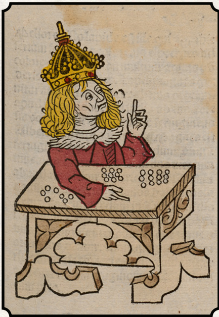
Pierre, an Absent King