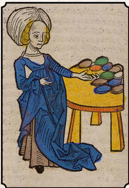
Druette, a Melancholy Princess