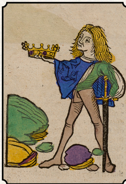
Arthus, an Ardent Prince