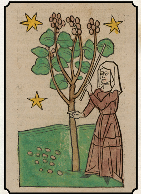
Magdelaine, a Loyal Servant