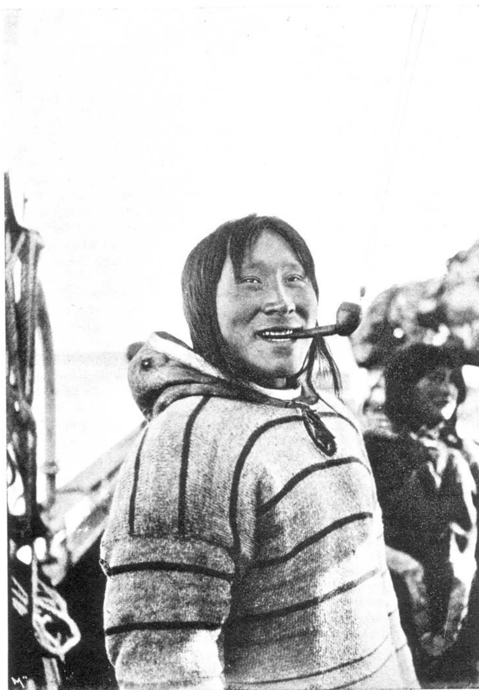
Netschillieskimåer kommer på besök. Den första röken.