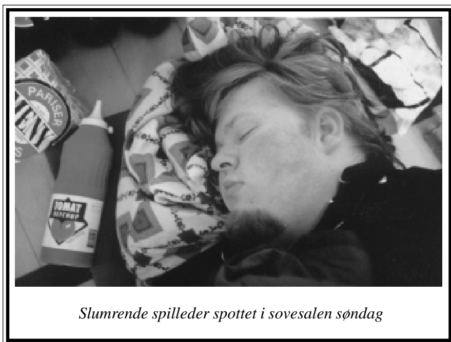
Slumrende spiller spottet i sovesalen søndag