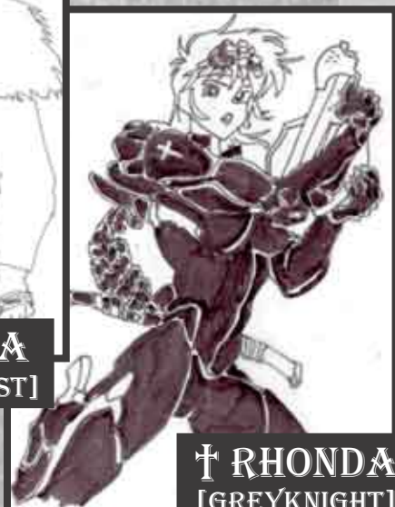
† RHONDA [GREYKNIGHT]