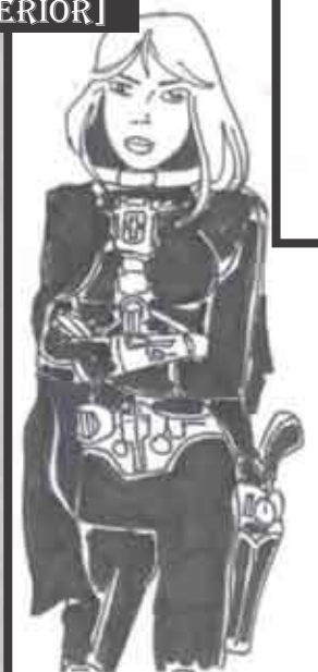
† ZENIA [SUPERIOR]