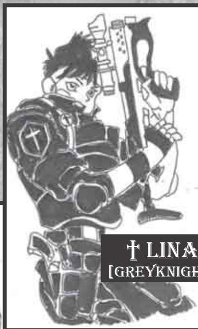
† LINA [GREYKNIGHT]

Spilpersonerne er en gruppe professionelle "specialister", der af de fleste regeringer vil blive betegnet som gravrøvere, kunsttyve og lejesoldater. De arbejder for en hemmelig organisation med rødder i Jesuiterordenen og Vatikanet, hvor deres pligt er at forhindre dæmoners adgang til verdenen - og når det fejler, gør de en aktiv indsats for at monstrene bliver sendt tilbage til det helvede, de kommer fra.