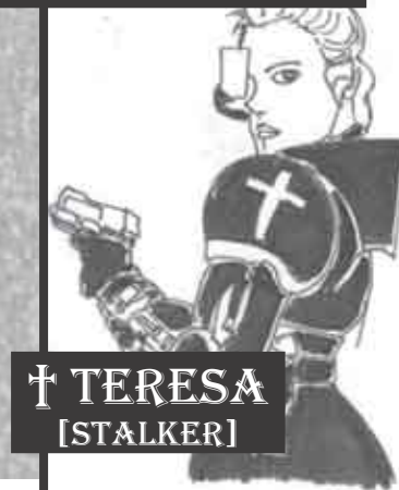
† TERESA [STALKER]