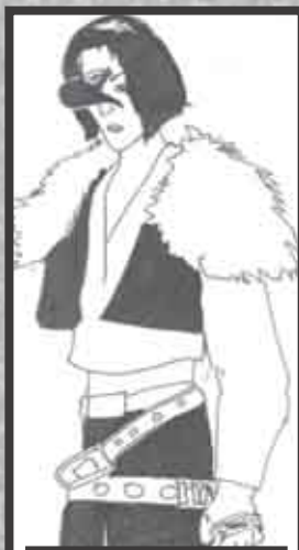
† VEXIA [STIGMATIST]