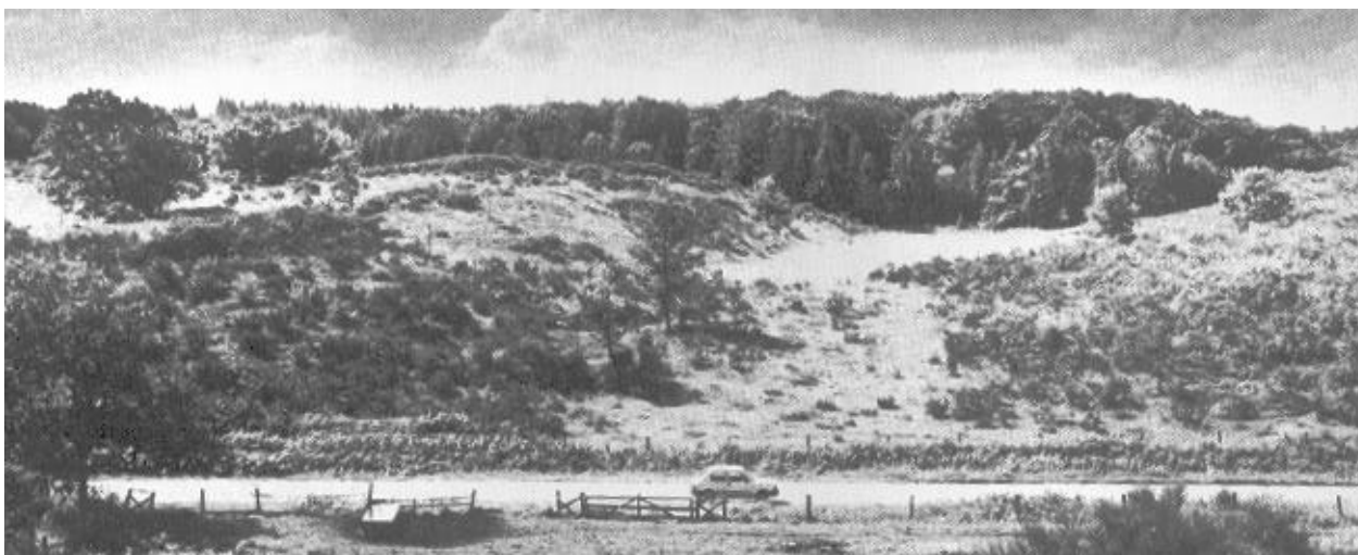
Udsigt mod en lille del af Hammer Bakker

I virkeligheden var det den unge Nikita, der var den første til at gå op af trapperne til overetagen. Familien havde besluttet at tage ud til Krageflugt nogen tid før aftalen med politiet. De var alle nysgerrige oven på den overraskende opdagelse, at de havde arvet et hus og et mellemstort stykke skov. Samtidigt var de opfyldt af en nervøs energi efter lørdagens dramatiske begivenheder og nattens mareridt. De trængte med andre ord til at foretage sig noget. - Næsten hvad som helst. Allerede fra starten havde Krageflugt gjort et meget stærkt og foruroligende indtryk på dem. Men det hele blev nu sat noget i skyggen af disse nye