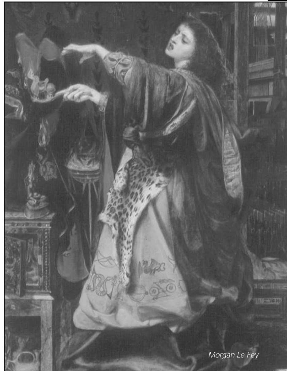
Morgan Le Fey

Mølledal er opført i midten af firserne og ligner et meget langstrakt og meget kedeligt parcelhus på en pløjemark. Indretningen er præget af et socialpædagogisk farvevalg og bærer desuden præg af et velment - men mislykket - forsøg på at skabe hygge. Beboerne betragtes ikke som farlige i egentlig forstand, men der er alligevel en hel del sikkerhedsforanstaltninger, der skal sikre personalet mod beboerne og beboerne mod sig selv. Hoveddøren er