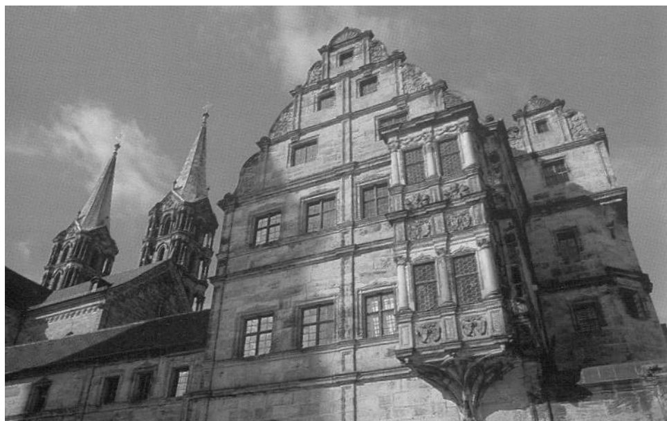
Heksehuset i Bamberg, opført i 1600-tallet som redskab for heksejagten.

I hvert af Mølledals mange rum er der installeret et kalde-apparat med højttaler. - Man kan herfra kontakte den vagthavende i glasburet, og man kan udsende opkald til hvert enkelt apparat eller til alle systemets højttalere på en gang. Og netop nu - henimod slutningen af advokatens forklaring - er det den sidstnævnte mulighed, som den åbenbart panikslagne social- og sundhedsmedhjælper Anne Lise benytter sig af. Hendes stemme, hysterisk, men hviskende, lyder elektronisk forstærket gennem de mange højttalere: "Hjælp mig for Guds skyld... Her ER altså noget..." Nogen rumsterende lyde høres, og så begynder hun at skrig. Højt, vildt og gennemtrængende... og pludseligt afbrudt. Det hele virker endnu mere voldsomt, sært og urealistisk på grund af den elektroniske for-