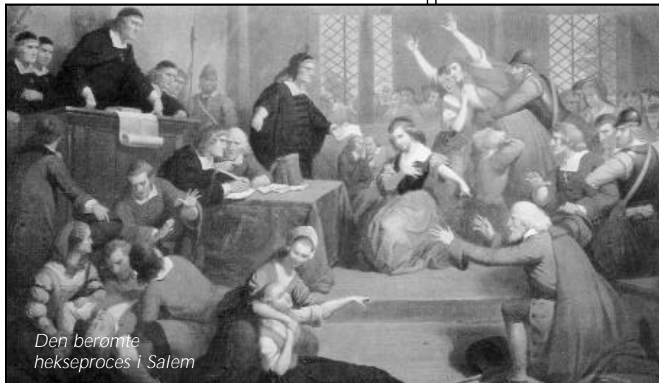
Den berømte hekseproces i Salem